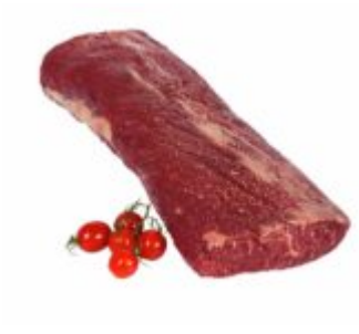
Storfe Ytrefilet Marmorert Fr Pk